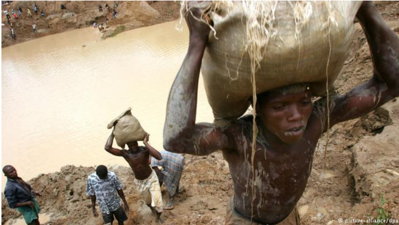
Situation of rivers infect by drainage mine